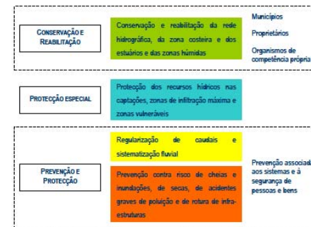
Figura 3. Tipologias das medidas de protecção e valorização dos recursos hídricos.

Tipologias das medidas de protecção e valorização