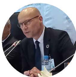
Mr. Henk Ovink

Ils ont, exprimé leur soutien au Plan d'Action de Dakar pour les bassins des fleuves, des lacs et des aquifères; et ont fait part de leurs conseils pour assurer sa promotion: