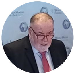
Mr. Loïc Fauchon Président du Conseil Mondial de l'Eau

La cérémonie d'ouverture officielle a donné lieu à l'intervention d'orateurs politiques de haut niveau soutenant le rôle de la gestion de bassin pour l'atteinte de tous les ODD liés à l'eau