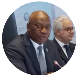
Mr. Serigne Mbaye Thiam Ministre de l'Eau, Sénégal